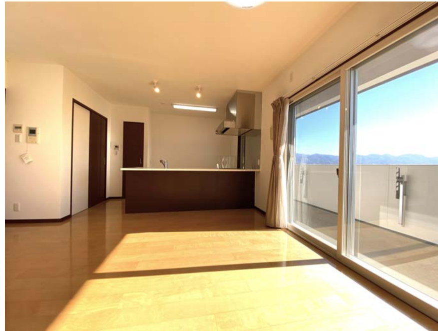
11階高層階南向き、LDK約17帖の、永住の邸宅にふさわしい贅沢な住空間。