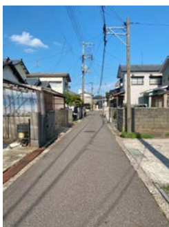
※前面道路 | 南東側4m