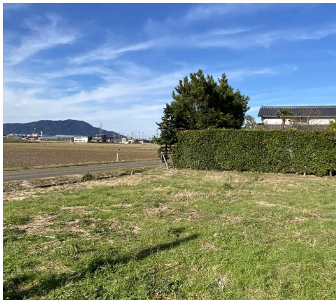
整形地,プロパンガス,電気,上水道,側溝,浄化槽

緑豊かな街路の木々が、落ち着いた暮らしを叶えてくれる静かな住環境。晴れた日には弥彦山脈が一望できる、視界180度のビューポイント。山に沈む夕日や、秋には遠くの紅葉も楽しめる、季節の自然と共に過ごす贅沢な時間……。西側の眺望、採光・通風の期待できる南東側に接道した優れた立地。