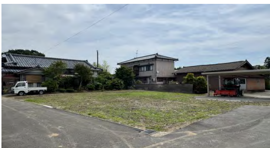
敷地全景1：南西向きの採光に恵まれた明るい住環境。