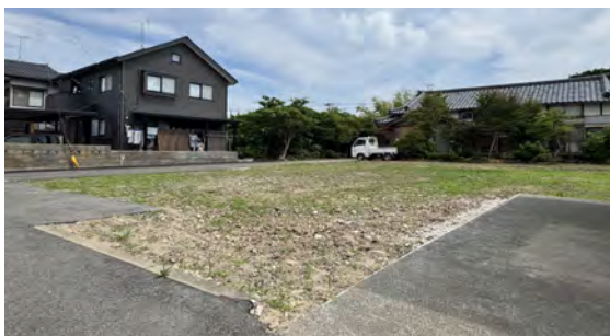
敷地全景2：建築条件無し、住宅会社の選択も自由。

信越本線荻川駅まで徒歩約13分、通勤・通学に便利な好立地。 採光・通風に恵まれた、明るく気持ちのいい南西向き宅地。