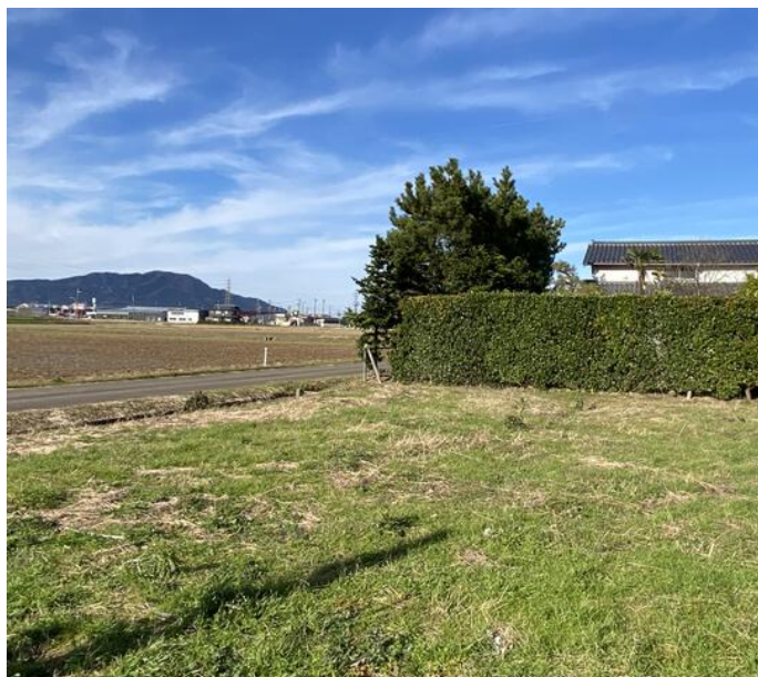
整形地,プロパンガス,電気,上水道,側溝,浄化槽

緑豊かな街路の木々が、落ち着いた暮らしを叶えてくれる静かな住環境。晴れた日には弥彦山脈が一望できる、視界180度のビューポイント。山に沈む夕日や、秋には遠くの紅葉も楽しめる、季節の自然と共に過ごす贅沢な時間……。西側の眺望、採光・通風の期待できる南東側に接道した優れた立地。